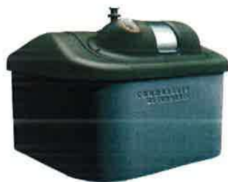
Container Semi-enterré (CSE)

Lucie Commare présente ensuite un îlot type tel qu'il sera installé :