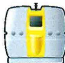
tri emballages recyclables

Lucie Commare indique que 4 îlots sont nécessaires pour la commune car il faut